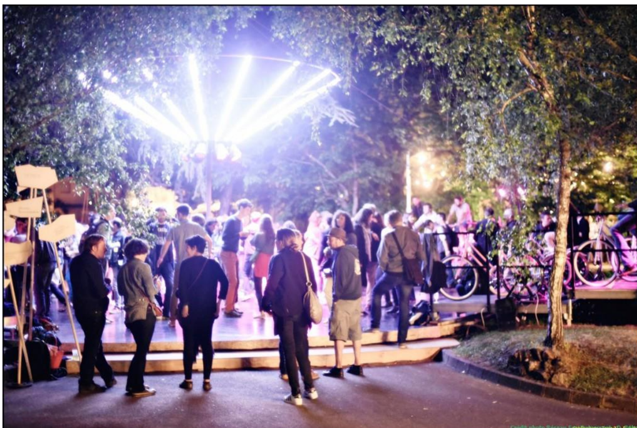
Le festival "Tous terriens" du Grand T, un événement précurseur en la matière.