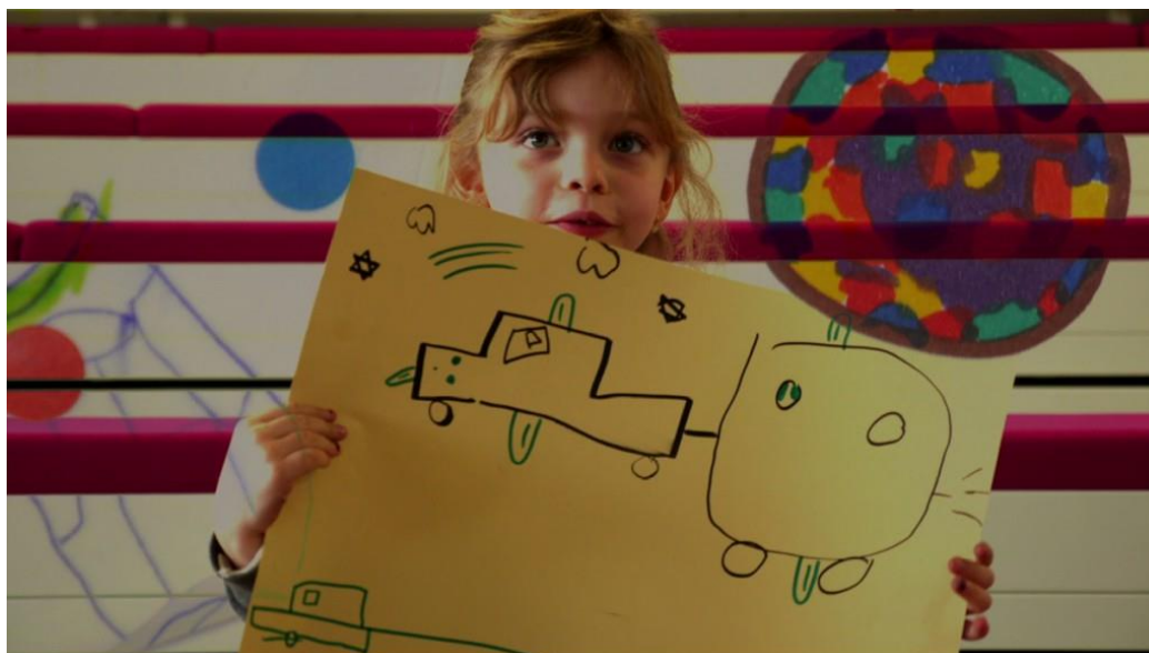
Extrait de la vidéo des ateliers créatifs

Les contributeurs bénéficieront de contreparties apportées par les événements avec lesquels le réseau travaille : de la boisson à des moments VIP. Près d'une quinzaine d'entre eux sont partenaires de la campagne et seront dévoilés au fur et à mesure. Les adhérents du REEVE les plus motivés se constituent en un groupe d'ambassadeurs et auront pour mission de dynamiser la campagne.